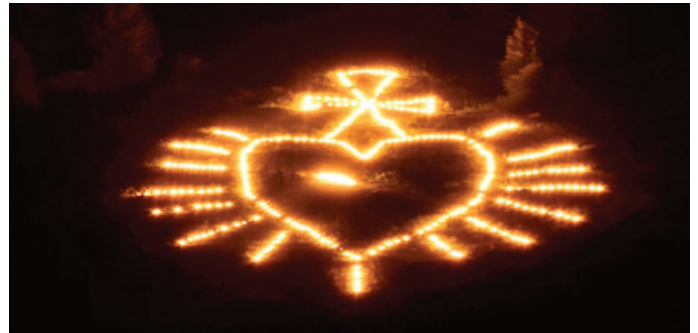
Herz Jesu Feuer in Schwendt

Am dritten Samstag nach dem Pfingstsonntag werden in Schwendt und Kössen die Herz-Jesu-Feuer entzündet. Ihr Ursprung geht auf das Jahr 1796 zurück, damals besiegte Napoleon in Norditalien die Armeen der Habsburger. Tirol brauchte Dank des Landlibells von Kaiser Maximilian I. keine Truppen stellen und keine finanzielle Unterstützung leisten, musste dafür aber selbst seine Grenzen verteidigen. Angesichts der Bedrohung durch Napoleon gelobten die Tiroler Landstände in Bozen, das Land dem „Heiligsten Herzen Jesu“ anzuvertrauen, um so göttlichen Beistand zu erhalten und die Verteidigungsbereitschaft der Bevölkerung zu heben. Dieses Gelöbnis sollte jedes Jahr erneuert werden. Auch Andreas Hofer wiederholte dieses Gelöbnis 1809 vor der Schlacht am Berg Isel. Nach dem Sieg am Berg Isel wurde der Herz-Jesu-Sonntag zum Tiroler Feiertag. Heuer waren am 24. Juni die Herz-Jesu-Feuer und die Sonnwendfeuer gleichzeitig zu bewundern. Während sich in Schwendt (Hackeralm) Damen für das Abbrennen des Herz Jesu Feuers auszeichnen, ist es in Kössen (Naringalm) ein alljährlicher Höhepunkt der Schützenkompanie. -red-