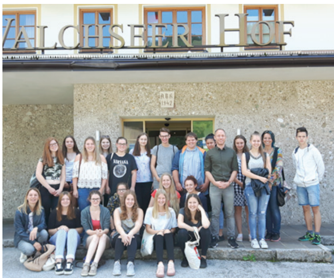
Die Klasse 1A der Wörgler Schule besuchte den Walchseer Hof in Walchsee

ist, legt großen Wert darauf, den Jugendlichen die Realität des Berufslebens darzulegen. „Die meisten Betriebe haben heute fixe Arbeitszeiten. Da hat sich Gravierendes geändert in den vergangenen Jahren“, erklärte er. -be-