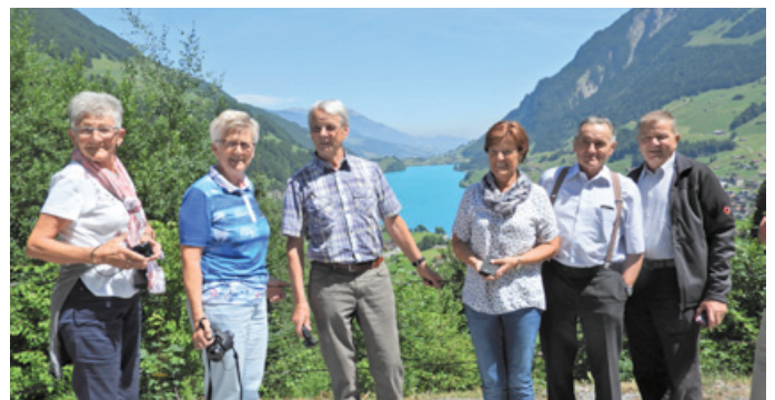
Postkartenidylle beim Lungerer See im Berner Oberland