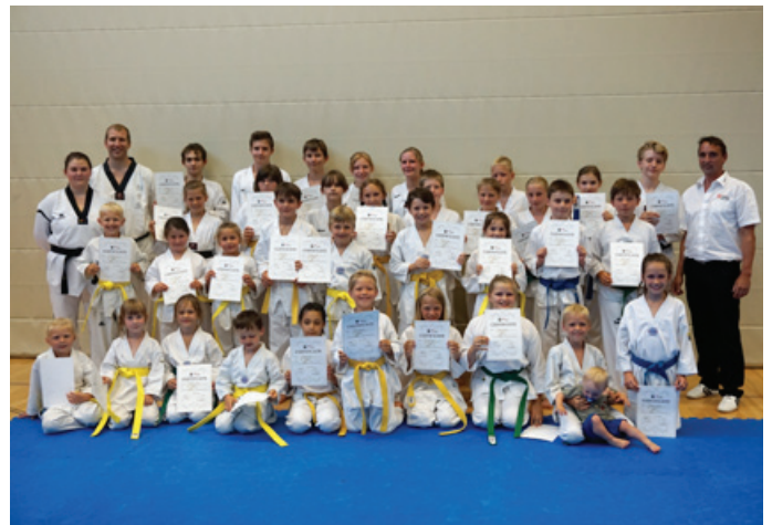
Gratulation den diesjährigen Gürtelprüflingen