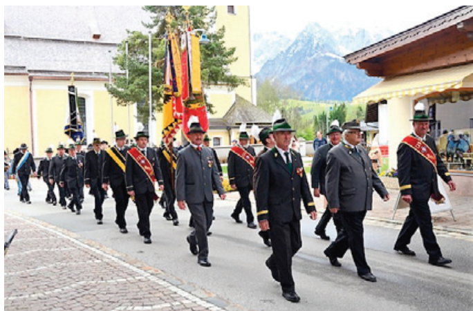
Abmarsch zur Jahreshauptversammlung 2014