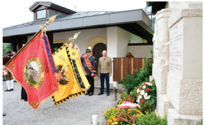
2014 Kranzniederlegung „100 Jahre Kriegsausbruch“ – im Bild die beiden Fahnen des Vereins