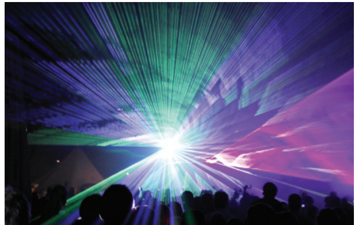
Eine fulminante Lasershow mit musikalischer Untermalung

Ausweichtermin bei Schlechtwetter ist jeweils der Donnerstag