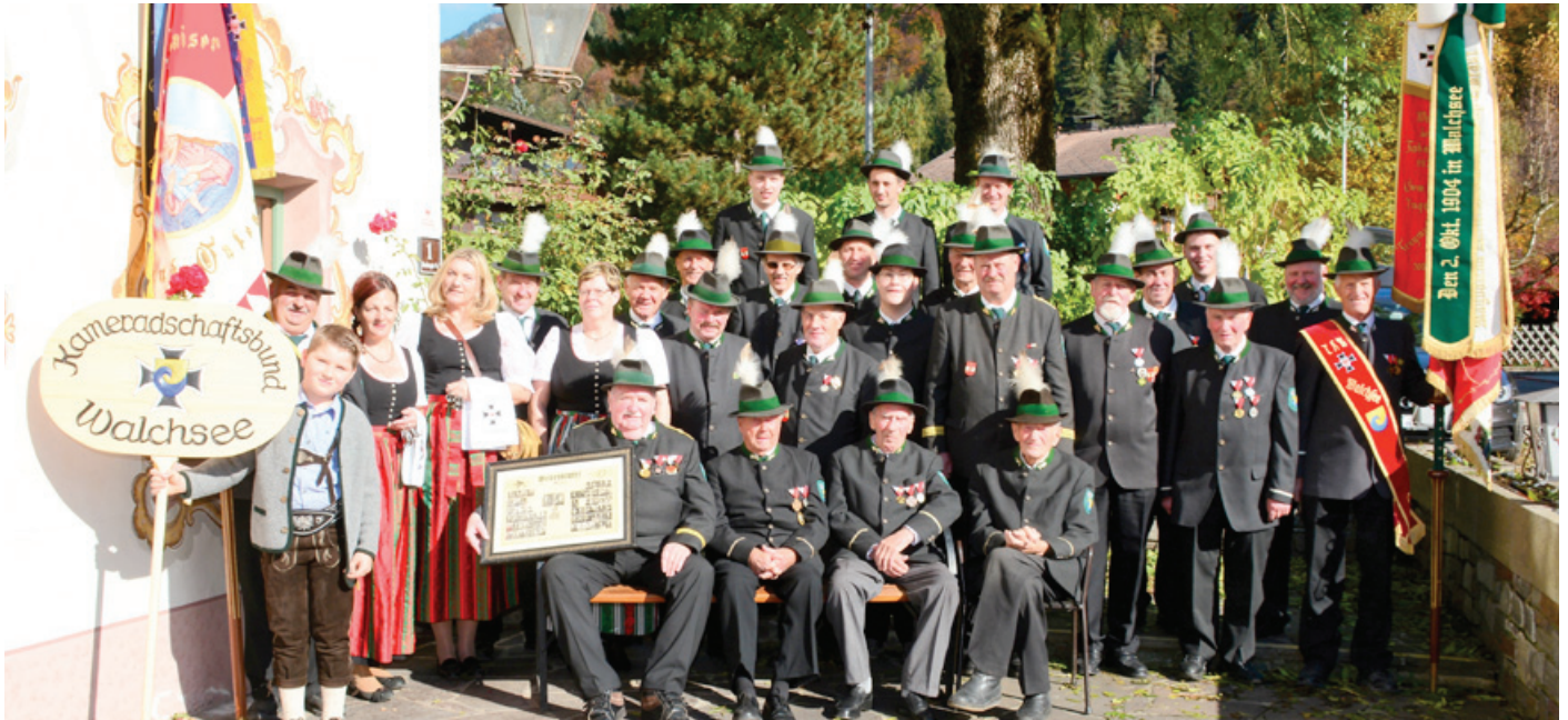
Die Kameradschaft Walchsee im Oktober 2016 – Dem Verein gehören aktuell 156 Mitglieder und ein Ehrenmitglied an