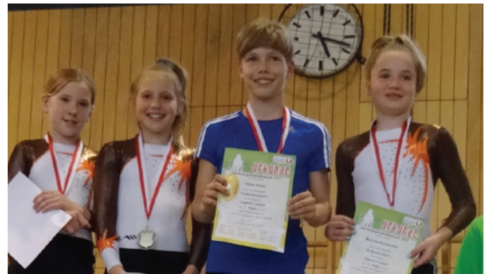
Die Union-Familie mit dem erfolgreichen Nachwuchs des TV Niederndorf