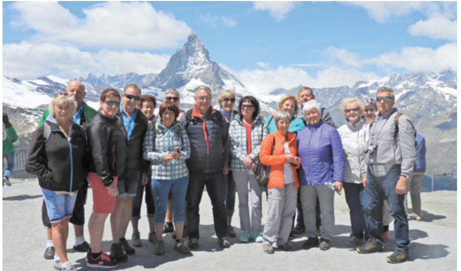
Teilnehmer der Reise vor dem unverkennbaren Matterhorn

Mit dem Mont Blanc Express ging es am dritten Tag über die Trientschlucht nach Chamonix. Ziel war eine Gondelfahrt auf den Aiguille du Midi (3.842 m). Während sich die erste Reisegruppe über einen uneingeschränkten Blick auf das Mont Blanc Massiv freuen durfte, hieß es für die zwei-