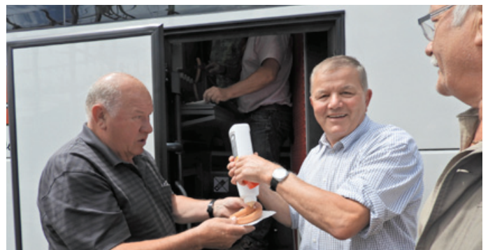
Würstelpause in der Schweiz. Die Reisenden waren sich einig, dass der ehemalige Politiker Sepp Hechenberger am besten dazu geeignet sei, bei jedem seinen Senf dazu zu geben