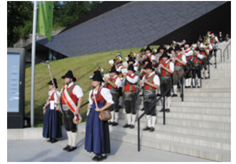
Die Musikkapelle Erl beim Empfang der Ehrengäste

Eröffnet wurden die Festspiele heuer mit Ludwig van Beethovens Ouvertüre zu „Coriolan“. Gefolgt von Wolfgang Amadeus Mozarts Ouvertüre zu „La clemenza di Tito“, sowie „Verleih uns Frieden gnädiglich“ von Felix Mendelssohn Bartholdy und schließlich Hans Rott's Symphonie Nr. 1, die Gustav Kuhn selbst dirigierte. Zum Abschluss der heurigen Festspiele kommt noch einmal Ludwig van Beethoven zur Aufführung. Am 30. Juli dirigiert Kuhn die 4. und 5. Symphonie.