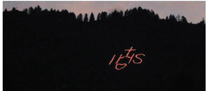
Herz Jesu Feuer in Kössen