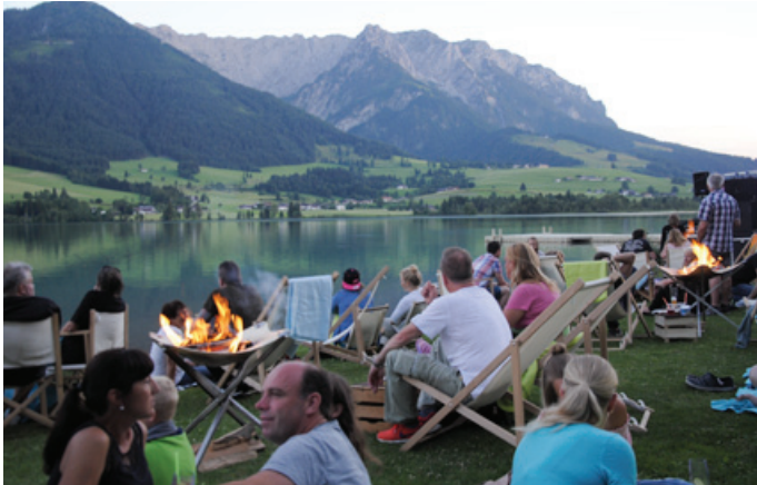
Entspannt einen gemeinsamen Abend am See genießen beim Kaiserwinkl Lichterzauber

Im Juli und August ist im Kaiserwinkl mittwochs immer der Lichterzauber angesagt, eine Kombination von Livemusik und Lasershow. Dem ersten Kaiserwinkl Lichterzauber dieses Jahres war ein herrlicher, lauer Sommerabend gegönnt und entsprechend entspannt war die Stimmung der zahlreichen Besucher am Ufer des Walchsees. Aus nah und fern kamen diese mit ihren Decken und Liegestühlen angereist um einen chilligen Abend mit Cocktails und Musik zu genießen. Sobald die Dunkelheit einsetzte begann dann die Show. Zum Rhythmus der Musik malen sich am Nachthimmel herrliche Ornamente aus Laser und Farben. Der Eintritt zum Kaiserwinkl Lichterzauber ist frei. -be-