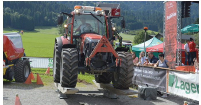
Es braucht viel Geschick um den Traktor auf der Wippe in Balance zu halten