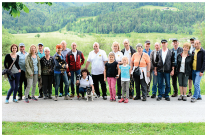
Ausflug 2016 rund um die Schwemm