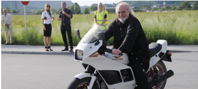
Der Dirigent Gustav Kuhn kam mit seiner geliebten Moto Guzzi zum Festspielhaus gefahren