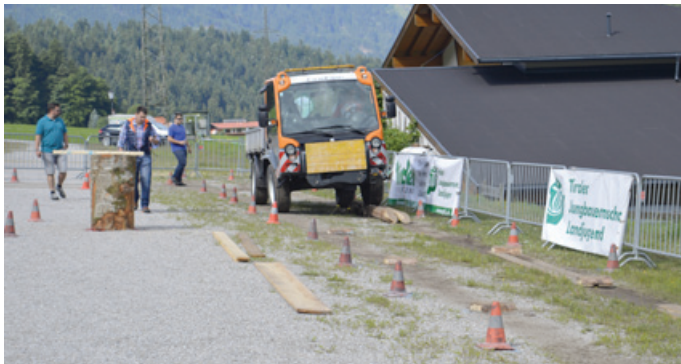
Mit dem Unitruck hieß es über Baumstämme zu fahren ohne abzurutschen

Auf dem Salvista-Parkplatz in Itter fand am 16. Juli die Qualifikation statt, danach startete der eigentliche Bewerb. Mit dem Geotrac von der Firma Lindner musste man über eine Wippe fahren, ein Mähgerät aufnehmen oder die Ballenpresse anhängen, um dann, möglichst zügig und fehlerfrei, die Hindernisstrecke zu befahren. Ebenso hieß es mit einem Unitrac sein Geschick auf Zeit zu beweisen.