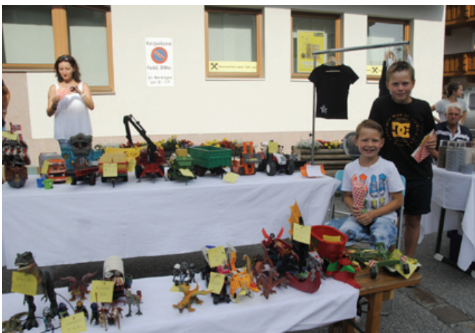
Die beiden Jungverkäufer sind froh darüber, dass sie mit einem Teil ihres nicht mehr benötigten Spielzeugs das Taschengeld aufbessern konnten

Dazu an verschiedenen Stellen zw. Musikpavillon und Fischerwirt Musik vom Feinsten. Weitere Termine: 4. und 25. August und 1. September. Nur bei trockenem Wetter. -be-