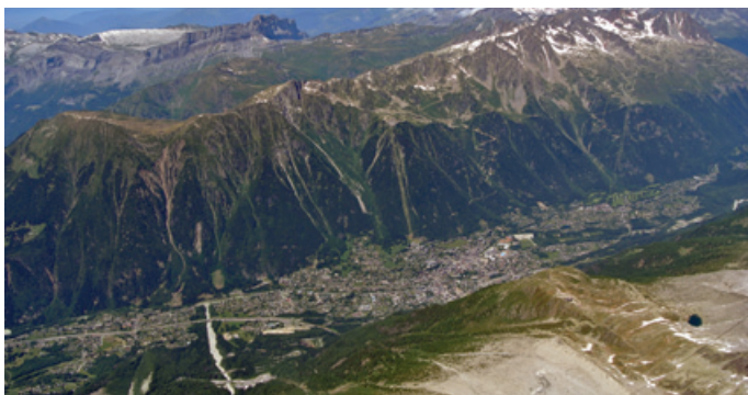
Der beeindruckende Blick aus der Gondel bei der Auffahrt zum Aiguille du Midi

Noch einmal steht heuer eine Reise auf dem Programm. Von 24. – 30. September geht es zu den „Perlen des Balkans“. Es ist dies eine siebentägige Rundreise, in der Sarajewo im Mittelpunkt steht. Zudem besuchen wir Zagreb, Mostar, Medjugorje, Split, Plitwitzer Seen und den Abschluss bildet eine Stadtrundfahrt mit dem Schiff in Ljubljana. Infos dazu unter www.wex-touristik.at oder Tel.: 05372/62222 -be-