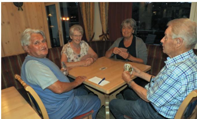
Kartenrunde abends im Hotel