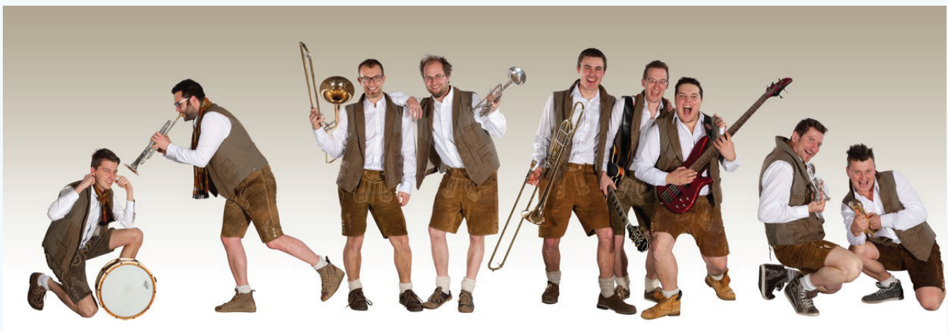
Am Freitag wird die „Südtiroler Hopfenmusik“ den Festgästen ordentlich einheizen!