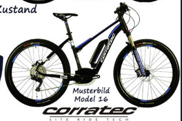
Musterbild Model 16