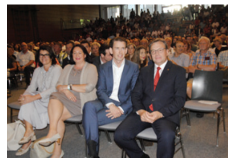
Bundesminister Sebastian Kurz und LH Günther Platter in der Kufstein Arena

Kurz und bündig – so könnte man den Auftritt von Sebastian Kurz beschreiben, denn in einer Stunde war der offizielle Teil, zu dem Besucher aus ganz Tirol, ja sogar aus Bayern, gekommen waren, vorbei. Anschließend jedoch war es eine endlose Schlange an Menschen, die sich zusammen mit dem Minister fotografieren lassen wollten und dieser lies es freundlich über sich ergehen. -be-