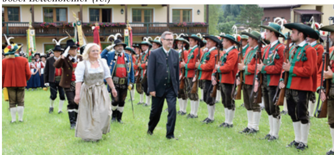
Frontabschreitung der Ehrenkompanie aus Silian in Osttirol