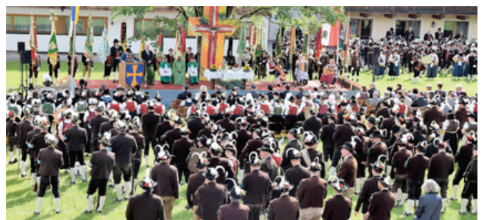
Klein, fein und feierlich – so das Motto der Nuaracher