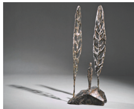
Anne Strobl, Stehender mit Bäumen – Öffnungszeiten: Di. – Sa. 10 – 12 Uhr, Do. 16 – 18 Uhr