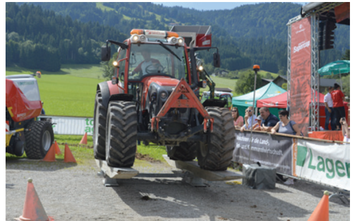
Es braucht viel Geschick um auf der Wippe die Balance zu halten.