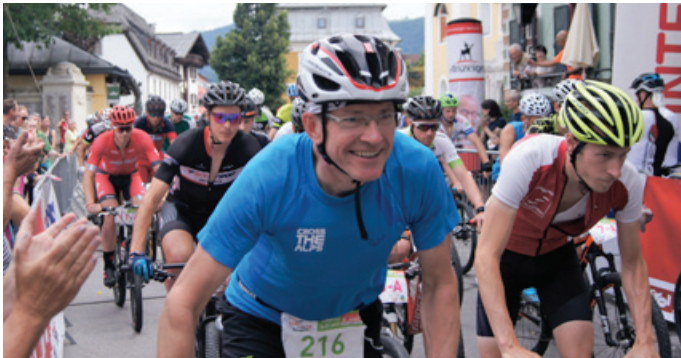
Neutralisierter Start am Hauptplatz

Zu bewältigen waren zuerst 500 Höhenmeter mit dem Rad und anschließend 600 Höhenmeter im Berglauf.