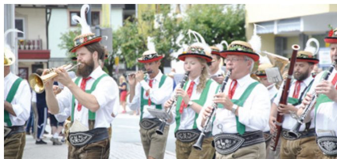
Die Stadtmusikkapelle Kitzbühel mit ihren Sommerhüten