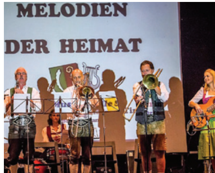
Tirol is oanzigartig (04. Aug.)

Steirer-Wein & „Das Bier von HIER“ bieten am 18. August ab 20.15 Uhr ein spannendes Hör- und Geschmackserlebnis,