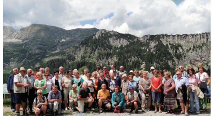
Die Seniorenbund-Funktionäre auf der Wurzeralm

Funktionäre der Ortsgruppen teil. Beeindruckend war die Besichtigung es Alpineum in Hinterstoder und das Benediktinerstift Schlierbach. -red-