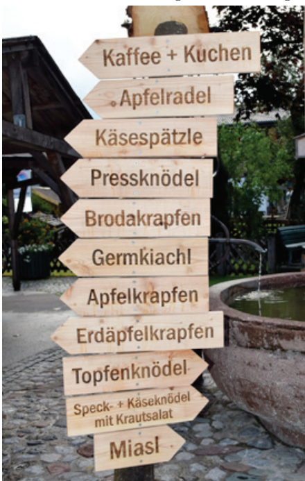
Die Bäuerinnen verwöhnen mit ...