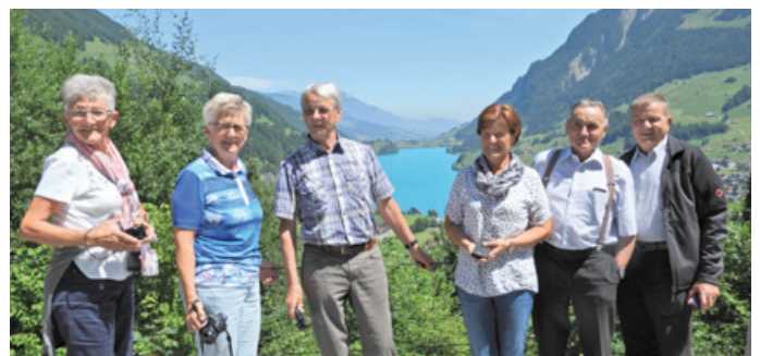
Postkartenidylle beim Lungereer See im Berner Oberland