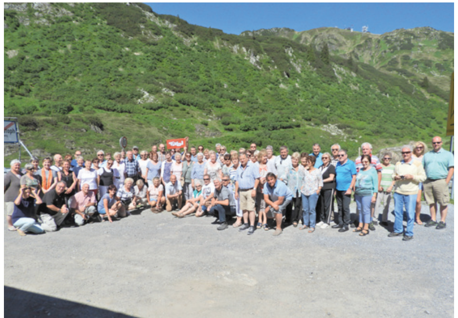
Gruppenfoto bei der Heimfahrt in St. Christoph

Mit dem Mont Blanc Express ging es am dritten Tag über die Trientschlucht nach Chamonix. Ziel war eine Gondelfahrt auf den Aiguille du Midi (3.842 m). Während sich die erste Reisegruppe über einen uneingeschränkten Blick auf das Mont Blanc Massiv freuen durfte, hieß es für die zweite Gruppe aussteigen und umdrehen in der Mittelstation. Das Wetter hatte sich in kurzer Zeit geändert und es tobte ein Schneesturm. Nachdem uns aber der volle Bahnpreis zurückgezahlt wurde, freuten sich die Reisenden an den übrigen wunderbaren Erlebnissen des Tages.