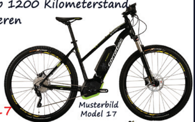
Musterbild Model 17