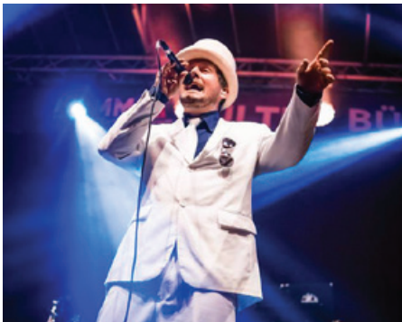
The Officers (28. Juli)