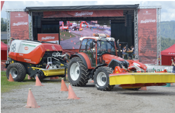
Mit Mähwerk und Ballenpresse auf dem Parcours

Auf dem Salvista-Parkplatz in Itter musste man mit dem Geotrac (Fa. Lindner) über eine Wippe fahren, ein Mähgerät aufnehmen bzw. die Ballenpresse anhängen, um dann, möglichst zügig und fehlerfrei, die Hindernisstrecke zu befahren. Ebenso hieß es mit einem Unitrac