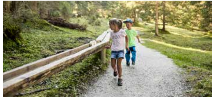
Wirbelspaß am Scheibenweg

Saisonende: 01.10.2023 Alle Infos unter www.schlick2000.at