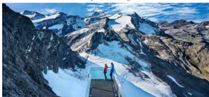
TOP OF SALZBURG / Gipfelwelt 3000 - Salzburgs höchstgelegenes Ausflugsziel auf 3.029 Metern

Auf 3.029 Metern ist der Gipfel des Kitzsteinhorn zum Greifen nah. Hier findet sich Salzburgs höchstgelegenes Ausflugsziel : TOP OF SALZBURG ist ganzjährig geöffnet und grenzt unmittelbar an den Nationalpark Hohe Tauern, dem größten Schutzgebiet der Alpen. Es ist der höchste per Seilbahnen erreichbare Punkt im Salzburger Land. Wer hier auf den beiden Panorama-Plattformen „TOP OF SALZBURG“ und „Nationalpark Gallery“ steht, genießt eine überwältigende Aussicht auf ein schier endloses Meer aus weißen Gipfeln, karstigen Felsen und grünen Hängen bis hinunter ins Zeller Becken. Im Cinema 3000 , Österreichs höchstgelegenes Kino, gibt es den Film „Kitzsteinhorn – THE NATURE“ zu sehen. Hier tauchen Zuseher ein in die faszinierende Pflanzen- und Tierwelt der Hohen Tauern. Die Nationalpark Gallery , ein 360 Meter langer Infostollen, verläuft direkt durch das Kitzsteinhorn. Auf dem Weg gibt es sechs Infostationen, die allerlei Wissenswertes offenbaren. Am Ende des Stollens angekommen, bietet die spektakuläre Aussicht von der gleichnamigen Panorama-Plattform einen starken Kontrast zur magischen Welt im Inneren des Kitzsteinhorn. Von hier aus ist außerdem der Gipfel des Großglockners zu sehen.