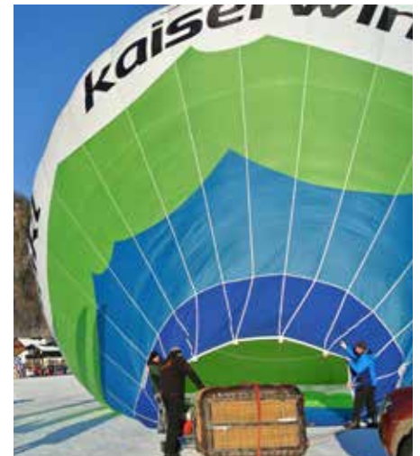
Der Kaiserwinkl-Ballon wird startklar gemacht.