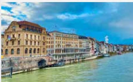
Basel am Rhein.

Am Vormittag fahren wir durch knallgelbe Rapsfelder Richtung Juraergebirge. Die dortige Landwirtschaft versorgt die Schweizer mit Weizen und Milch. Traditionelle Orte und kleine Städte laden zum Verweilen ein. Am Nachmittag besichtigen wir Basel, spazieren durch die schmalen Gassen der Altstadt, besuchen das „Basler Leckerli Huus“ und den farbenfrohen Marktplatz sowie einige Sehenswürdigkeiten. Auf Wunsch können Sie auch an einer Stadtrundfahrt per Schiff teilnehmen ( vor Ort zahlbar ). Nach dem Abendessen erwartet uns ein Highlight: Die Bundesfeier beginnt mit dem Glockengeläut der Tituskirche, auf einer Bühne gibt es moderne und traditionelle Musik- und Gesangsformationen. Beeindruckender Abschluss ist eine Licht- und Wassershow mit Feuerwerk um 22:15 Uhr. Anschließend Bustransfer zurück ins Hotel.