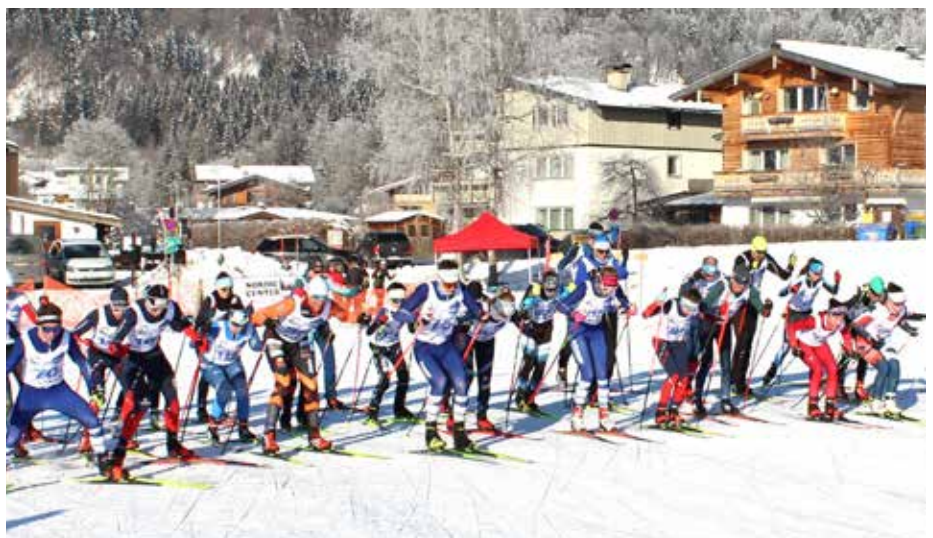
Start zum 44. Silvesterlanglauf.