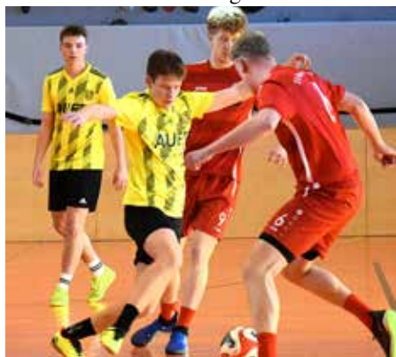
Spiel Walchsee gegen Niederndorf.