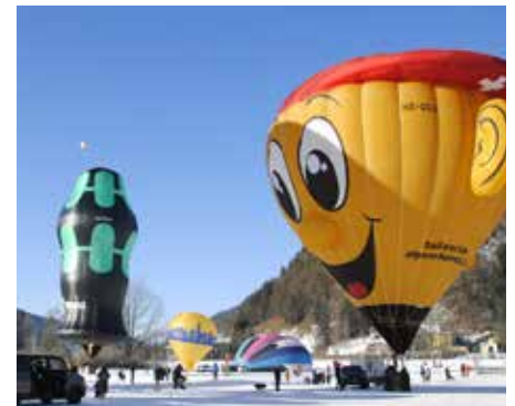
Kreative Ballone sind absolute Hingucker.