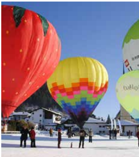
Drei neue Miniballons wurden getauft.