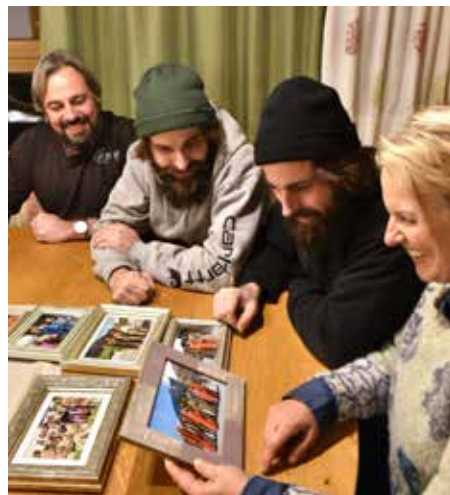
Die Familienfotos wecken Erinnerungen an unvergessliche Passionsjahre.