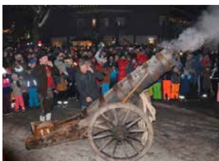
Kanonenschuss zur Verabschiedung des alten Jahres.

Einmarsch der Traditionsvereine und Skilehrer am Dorfplatz.