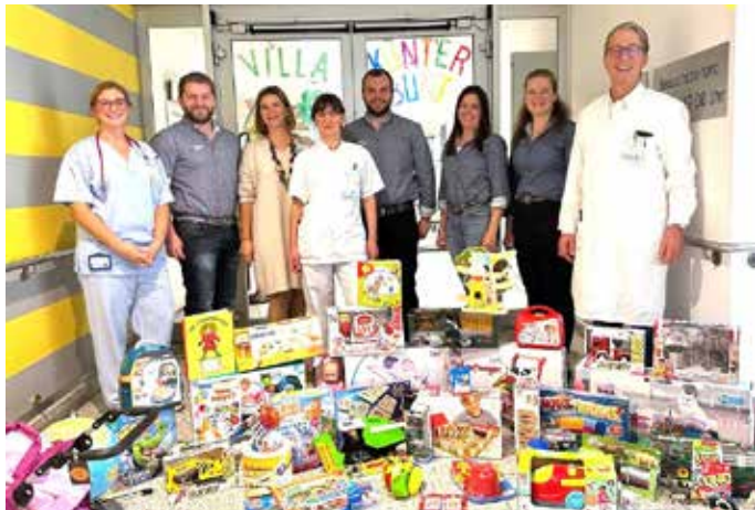
Spielwaren für die BKH-Kinderstation in Kufstein.