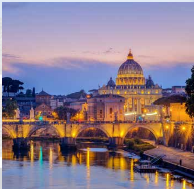
Das geschichtsträchtige Rom ist immer eine Reise wert.

Nach einem ausgiebigen Frühstück treten wir die Heimreise an. Um die Mittagszeit sind Sie im Raum Mantua in der Risotteria eingeladen. Dann geht es entgültig zurück nach Tirol.