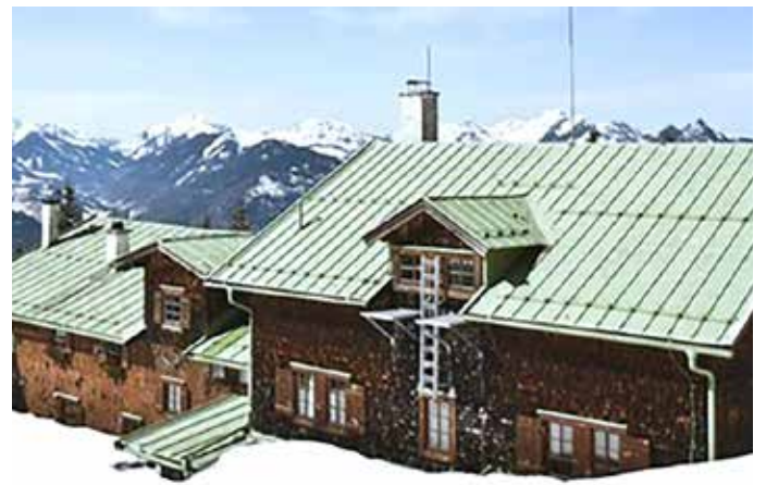
Die Vorderkaiserfeldenhütte wird umfassend saniert.