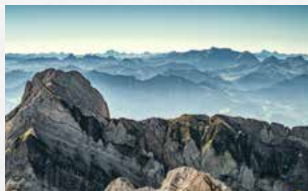
Imposantes Panorama vom Säntis.