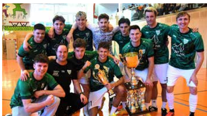
SK Ebbs II verwies den SV Niederndorf 1b auf Platz zwei und gewann den Wanderpokal.