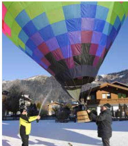
GF Thomas Schönwälder taufte die neuen Mini-ballone mit Sekt.