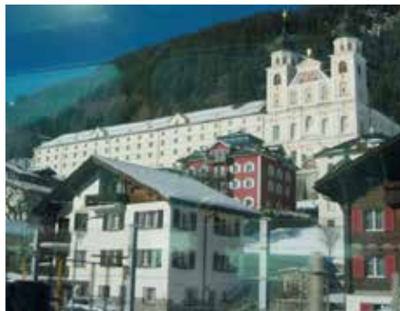
Das Kloster Disentis kurz vor Andermatt.