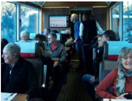
Mit dem Glacier-Express durch die Winterlandschaft.

Lichterfest in Luzern auf dem Programm. Der Lichterzauber reichte von einfachen Bestrahlungen von Gebäuden bis zu bewegten Animationen beim Schweizerhof. Dazu gab es Musik in leisen Tönen, sodass man den Zauber mit allen Sinnen genießen konnte. Bei der Heimfahrt besuchten wir noch die Schaukäserei in Stein im Appenzell und fuhren bei Traumwetter über den Arlbergpass und nicht durch den Tunnel. -be-