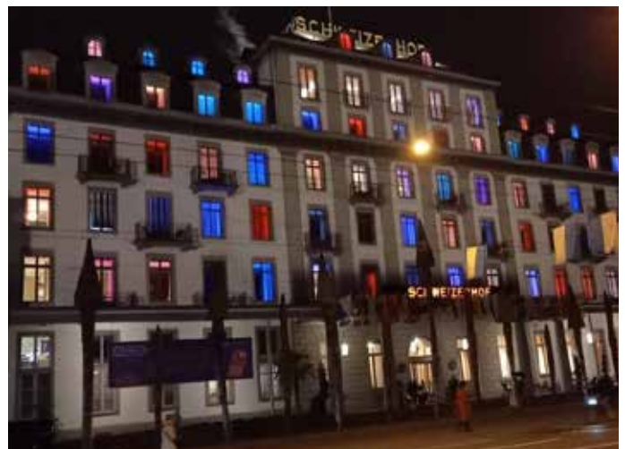
Der noble Schweizerhof zeigte sich bunt.