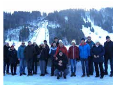
Einige Reisende vor der Sprungschanze in Engelberg.