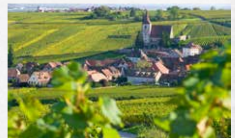
Weindorf Eguisheim im Elsass.