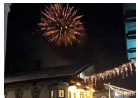
Die Feuerwerker verstanden ihr Handwerk.