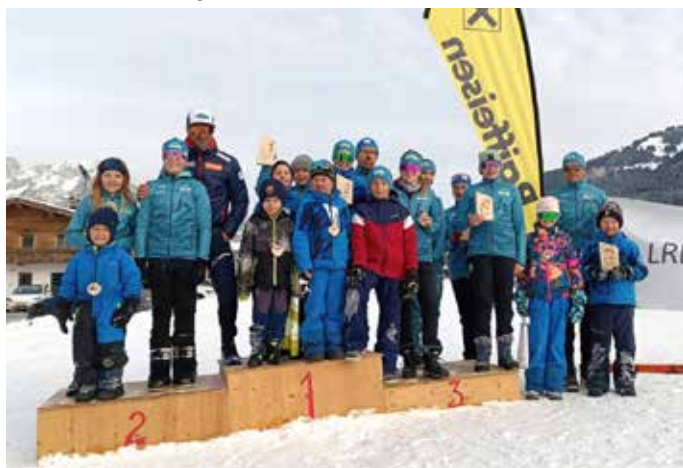
Die erfolgreichen Bezirkscup-Teilnehmer in Söll.