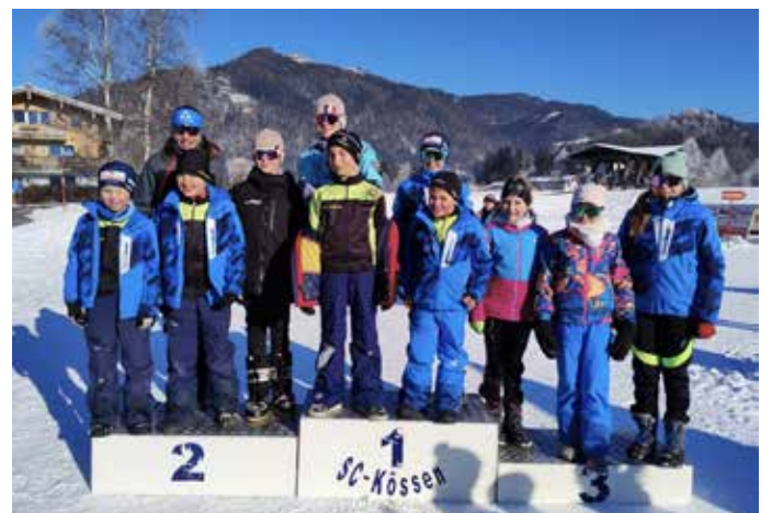
Die LLC-Kids überzeugten beim Silvesterlauf.