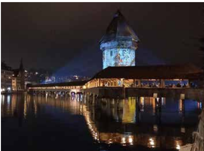
Das Luzerner Wahrzeichen, die Kapellbrücke, beim Lichterfest.